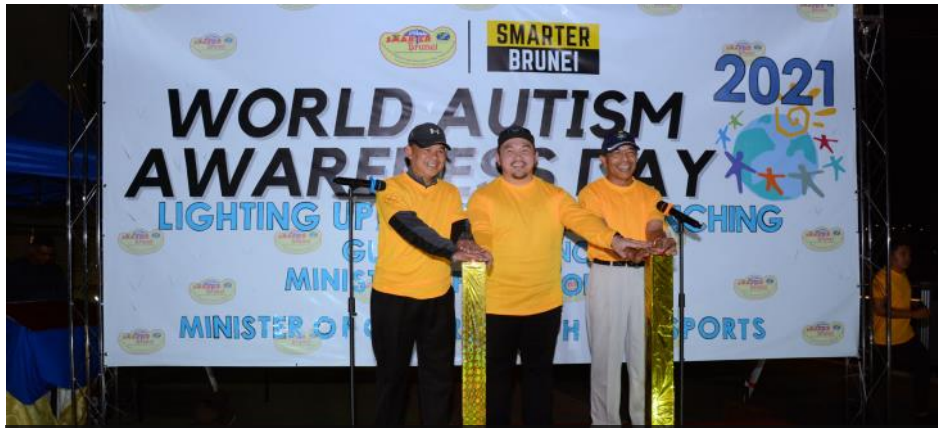
Menteri Pembangunan, Yang Berhormat Dato Seri Setia Ir. Awang Haji Suhaimi bin Haji Gafar dan Menteri Kebudayaan, Belia dan Sukan, Yang Berhormat Mejar Jeneral (B) Dato Paduka Seri Haji Aminuddin Ihsan bin Pehin Orang Kaya Saiful Mulok Dato Seri Paduka Haji Abidin selaku tetamu kehormat menyempurnakan pelancaran Sambutan WAAD.