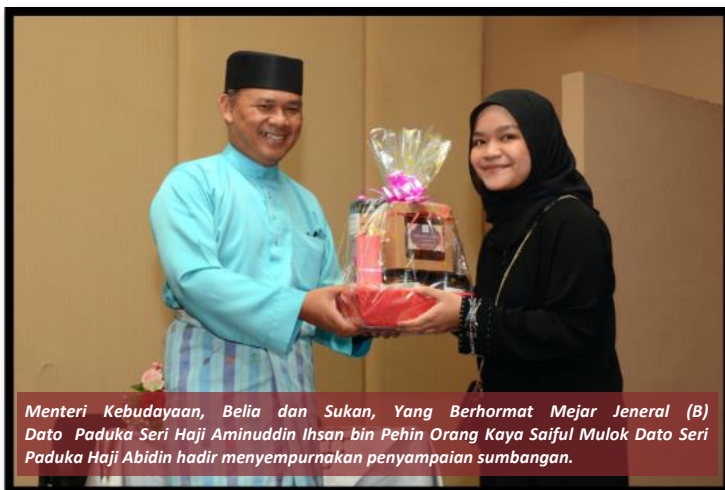
Menteri Kebudayaan, Belia dan Sukan, Yang Berhormat Mejar Jeneral (B) Dato Paduka Seri Haji Aminuddin Ihsan bin Pehin Orang Kaya Saiful Mulok Dato Seri Paduka Haji Abidin hadir menyempurnakan penyampaian sumbangan.

Pada majlis tersebut, Yang Berhormat Menteri Kebudayaan, Belia dan Sukan menyampaikan sumbangan berupa Mini Hamper Kasih PPB kepada mereka yang diraikan, diikuti dengan bacaan Tahlil, disusuli dengan Majlis Berbuka Puasa.