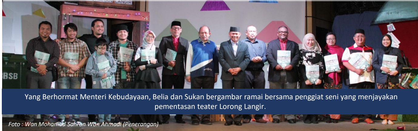
Yang Berhormat Menteri Kebudayaan, Belia dan Sukan bergambar ramai bersama penggiat seni yang menjayakan pementasan teater Lorong Langir.