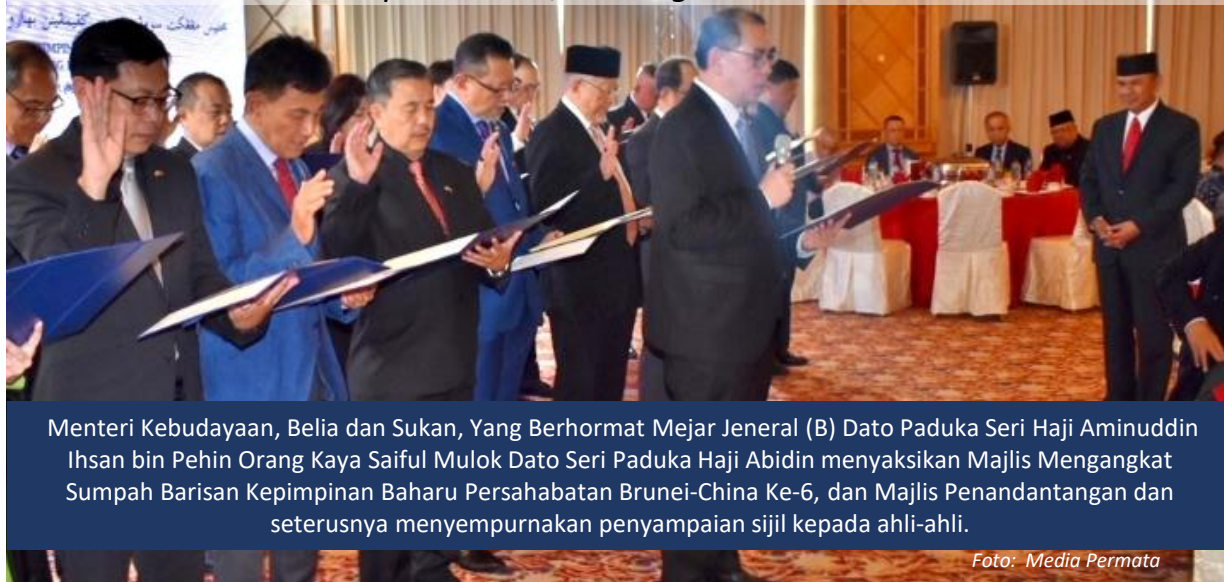
Menteri Kebudayaan, Belia dan Sukan, Yang Berhormat Mejar Jeneral (B) Dato Paduka Seri Haji Aminuddin Ihsan bin Pehin Orang Kaya Saiful Mulok Dato Seri Paduka Haji Abidin menyaksikan Majlis Mengangkat Sumpah Barisan Kepimpinan Baharu Persahabatan Brunei-China Ke-6, dan Majlis Penandatangan dan seterusnya menyempurnakan penyampaian sijil kepada ahli-ahli.