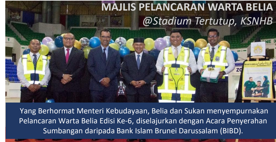
Yang Berhormat Menteri Kebudayaan, Belia dan Sukan menyempurnakan Pelancaran Warta Belia Edisi Ke-6, diselenggarakan dengan Acara Penyerahan Sumbangan daripada Bank Islam Brunei Darussalam (BIBD).