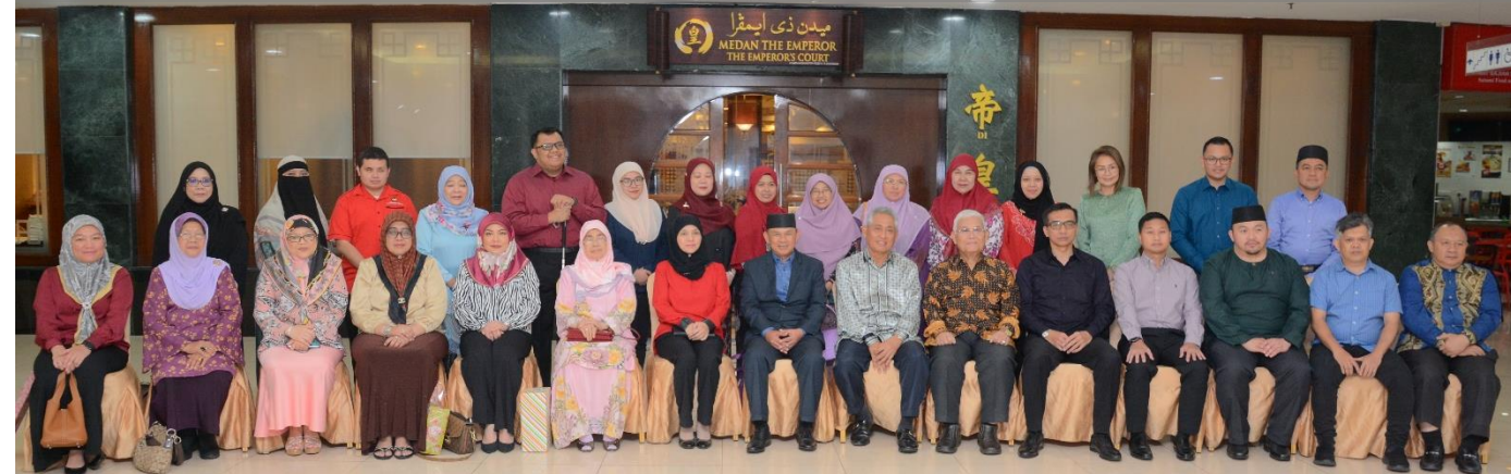
Yang Berhormat Menteri Kebudayaan, Belia dan Sukan dan Datin, disertai pegawai-pegawai kanan Kementerian Kebudayaan, Belia dan Sukan menghadiri Majlis Makan Malam Tahunan (Annual Dinner) Tahun 2020 anjuran MKOKU yang merupakan rakan strategik KKBS dalam memeduli golongan OKU.

Sejak MKOKU didaftarkan pada 21 Mei 2016 menurut ceraihan (3) Bab 8 dari Akta Pertubuhan Penggal 203, sembilan persatuan telah bergabung di bawah payung MKOKU terdiri dari Pusat Ehsan Al-Ameerah Al-Hajjah Maryam; Society for the Management of Autism Related Issues in Training, Education and Resources (SMARTER); Persatuan Kanak-Kanak Cacat (KACA); Special Olympic Brunei Darussalam (SOBD); Persatuan Orang Kurang Pendengaran (OKP); Persatuan Sindrom Down (ABLE); Brunei Darussalam Association for the Blind (BDNAB); Persatuan Paraplegic and Physically Disable Association (PAPDA) dan Learning Ladders Society (LLS).