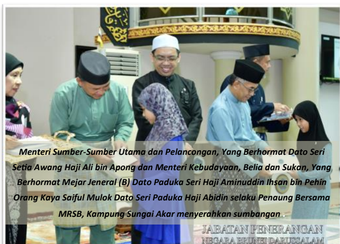
Menteri Sumber-Sumber Utama dan Pelancongan, Yang Berhormat Dato Seri Setia Awang Haji Ali bin Apong dan Menteri Kebudayaan, Belia dan Sukan, Yang Berhormat Mejar Jeneral (B) Dato Paduka Seri Haji Aminuddin Ihsan bin Pehin Orang Kaya Saiful Mulok Dato Seri Paduka Haji Abidin selaku Penaung Bersama MRSB, Kampung Sungai Akar menyerahkan sumbangan.

JABATAN PENERANGAN NEGARA TERUNJUNG DARUSSALAM