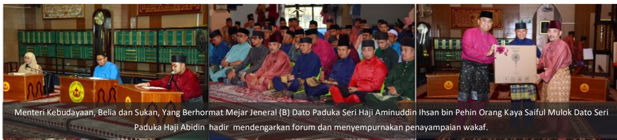
Menteri Kebudayaan, Belia dan Sukan, Yang Berhormat Mejar Jeneral (B) Dato Paduka Seri Haji Aminuddin Ihsan bin Pehin Orang Kaya Saiful Mulok Dato Seri Paduka Haji Abidin hadir mendengarkan forum dan menyempurnakan penyampaian wakaf.