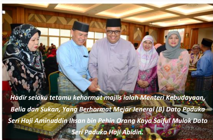
Hadir selaku tetamu kehormat majlis ialah Menteri Kebudayaan, Belia dan Sukan, Yang Berhormat Mejar Jeneral (B) Dato Paduka Seri Haji Aminuddin Ihsan bin Pehin Orang Kaya Saiful Mulok Dato Seri Paduka Haji Abidin.