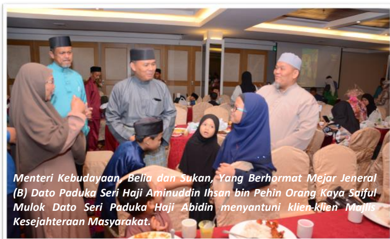
Menteri Kebudayaan, Belia dan Sukan, Yang Berhormat Mejar Jeneral (B) Dato Paduka Seri Haji Aminuddin Ihsan bin Pehin Orang Kaya Saiful Mulok Dato Seri Paduka Haji Abidin menyantuni klien-klien Majlis Kesejahteraan Masyarakat.