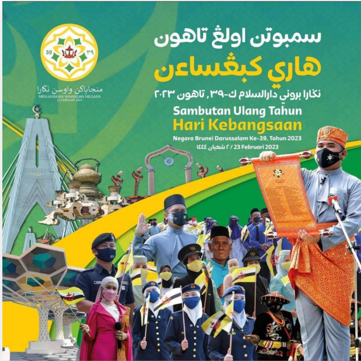
E-POSTER SEMPENA SAMBUTAN HARI KEBANGSAAN KE-39, TAHUN 2023