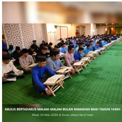
MAJLIS BERTADARUS MALAM-MALAM BULAN RAMADAN BAGI TAHUN 1445H Ahad, 24 Mac 2024 di Surau, Istana Nurul Iman