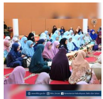
www.mba.gov.bn @mba_brunai Kementerian Kebudayaan, Belia dan Sukan