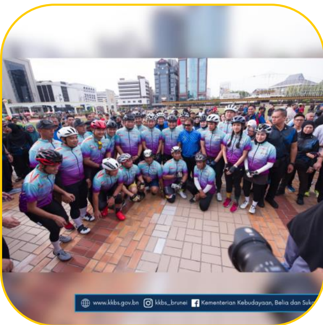
www.kkbs.gov.bn kkbs_brunei Kementerian Kebudayaan, Belia dan Sukan