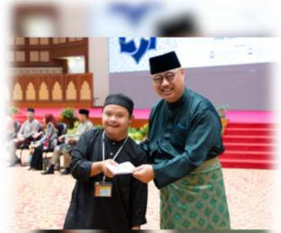
www.mba.gov.bn @mba_borneo Kementerian Kebudayaan, Belia dan Sukan