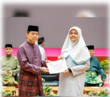
www.mba.gov.bn @mba_borneo Kementerian Kebudayaan, Belia dan Sukan

The Donation were collections of funds from Tabung Anak-Anak Yatim JAPEM, Tabung Dana Anak Yatim Daerah Brunei Muara dan BIBD donation. The donation from Tabung Anak-Anak Yatim JAPEM is BND358,100.00 . Meanwhile, Tabung Anak Yatim Daerah Brunei Muara donated BND34,935.00 dan BIBD donated BND179,050.00 .