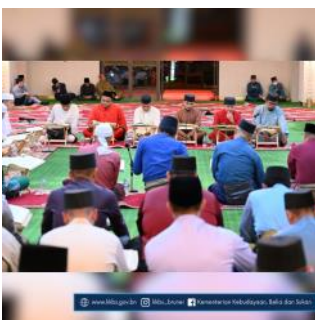
www.mba.gov.bn @mba_brunai Kementerian Kebudayaan, Belia dan Sukan

The event began with Sembahyang Fardu Isyak and Sembahyang Sunat Tarawih Berjemaah, followed by Tadarus Al-Quran. It concluded with the recitation of Doa Peliharakan Sultan dan Negara Brunei Darussalam. District Officers, senior officers, and other staff members of MCYS were also in attendance.