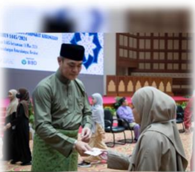
www.mba.gov.bn @mba_borneo Kementerian Kebudayaan, Belia dan Sukan

Attending as Guests of Honor were Yang Berhormat Dato Seri Setia Dr Awang Haji Mohd Amin Liew bin Abdullah, Minister in Prime Minister's Office dan Minister of Finance and Economy II as Chairman of Board of Directors of Bank Islam Brunei Darussalam, Yang Berhormat Dato Seri Setia Awang Haji Ahmaddin bin Haji Abdul Rahman, Minister of Home Affairs dan Yang Berhormat Dato Seri Setia Haji Awang Nazmi bin Haji Awang Mohamad, Minister of Culture, Youth and Sports.