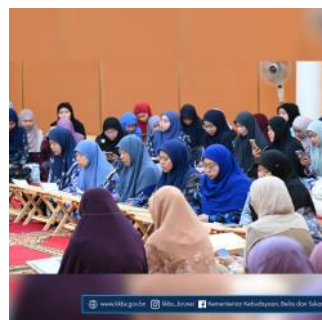
www.mba.gov.bn @mba_brunai Kementerian Kebudayaan, Belia dan Sukan