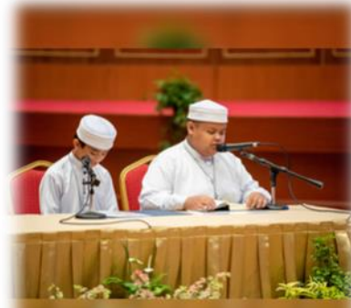
www.mba.gov.bn @mba_borneo Kementerian Kebudayaan, Belia dan Sukan