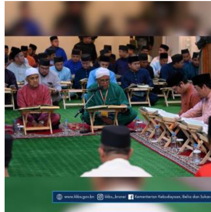
www.mba.gov.bn @mba_brunai Kementerian Kebudayaan, Belia dan Sukan