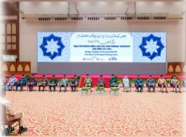
MAJLIS PENYAMPAIAN DERMA ANAK-ANAK YATIM PESINGKAT KEBANGSAAN SAKSI TAHUN 1445H/2024M