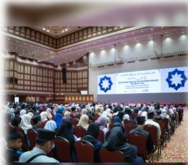
www.mba.gov.bn @mba_borneo Kementerian Kebudayaan, Belia dan Sukan