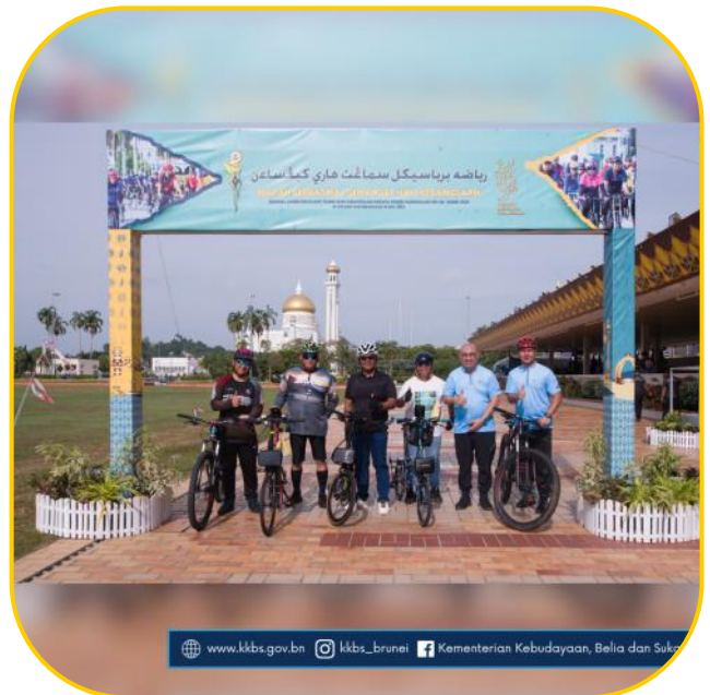
www.kkbs.gov.bn kkbs_brunei Kementerian Kebudayaan, Belia dan Sukan