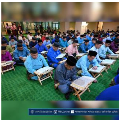
www.mba.gov.bn @mba_brunai Kementerian Kebudayaan, Belia dan Sukan