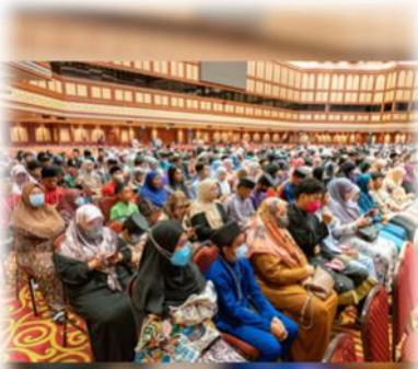
www.mba.gov.bn @mba_borneo Kementerian Kebudayaan, Belia dan Sukan

March 2024 – Ministry of Culture, Youth and Sports, through the Community Development Department in collaboration with Brunei and Muara District Office, Ministry of Home Affairs (MOHA) and Bank Islam Brunei Darussalam (BIBD) held the Donation Handover Ceremony for Orphans at the National Level. The event took place at di Plenary, International Convention Centre, Berakas.