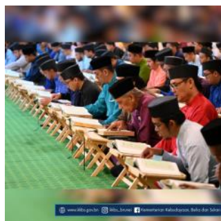
www.mba.gov.bn @mba_brunai Kementerian Kebudayaan, Belia dan Sukan