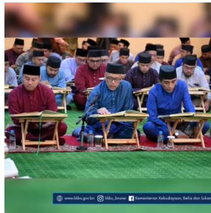
www.mba.gov.bn @mba_brunai Kementerian Kebudayaan, Belia dan Sukan

ISTANA NURUL IMAN, Sunday, 12 Ramadan 1445 / 24 March 2024 — Majlis Bertadarus Malam-malam Bulan Ramadan bagi Tahun 1445 Hijrah / 2024 Masihi continues on the 13th night of Ramadan at Surau, Istana Nurul Iman.