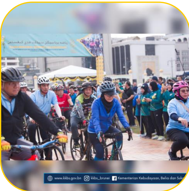
www.kkbs.gov.bn kkbs_brunei Kementerian Kebudayaan, Belia dan Sukan