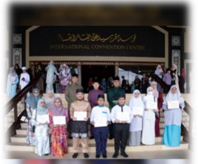
www.mba.gov.bn @mba_borneo Kementerian Kebudayaan, Belia dan Sukan